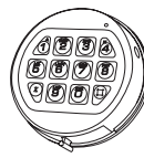
3750-K Runde EEH